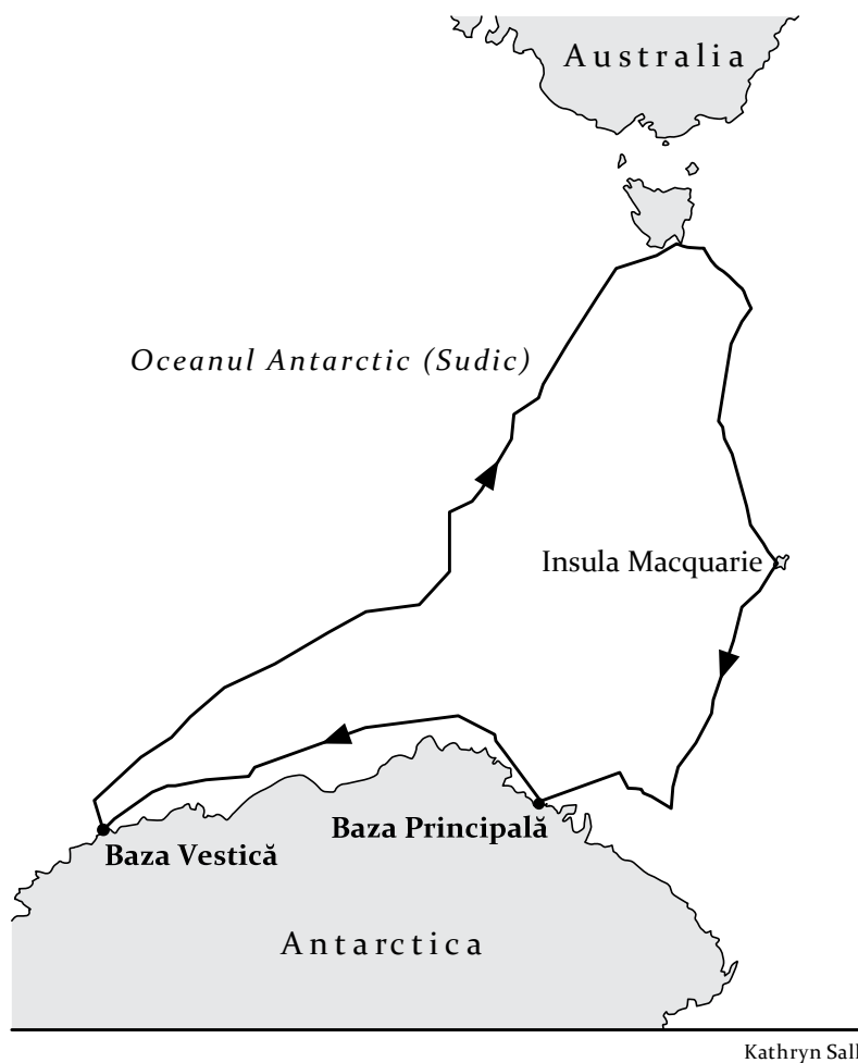
Ruta urmată de nava Aurora căt-re și dinspre Antarctica, 1911 – 1912