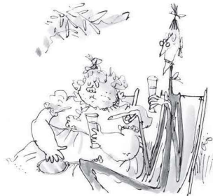
Mătușa Spiker & Mătușa Sponge