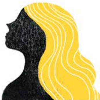
Freyja: cea mai frumoasă dintre zeițe, sora lui Freyr.