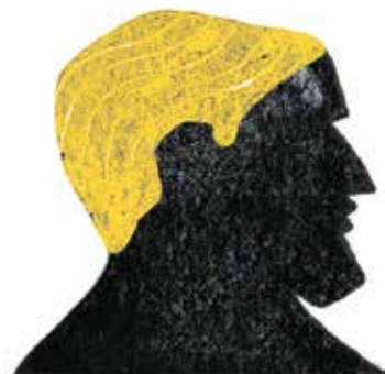
Balder: cel mai bun și mai blând dintre zei, fiul lui Odin și al lui Frigg.