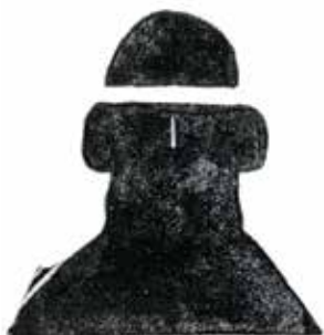
Hod: fratele orb al lui Balder.