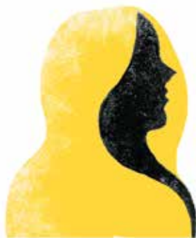
Sif: soția cu bucle aurii a lui Thor.