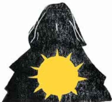
Freyr: zeul belșugului și al Soarelui, fratele Freyjei.