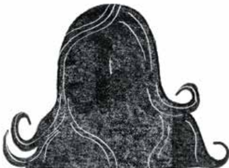
Frigg: cea mai însemnată dintre zeițe, soția lui Odin și mama lui Balder.