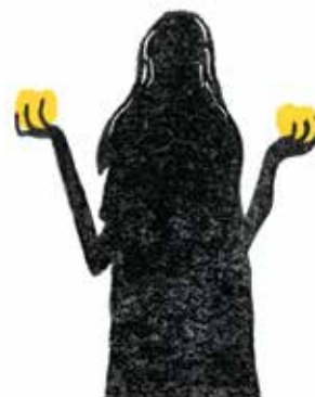
Idun: cea care se îngrijește de merele de aur ale tinereții.