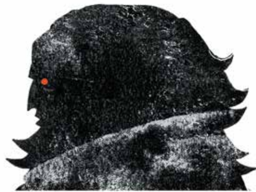
Thor: zeul tunetului, fiul lui Odin; luptă cu ajutorul ciocanului lui, Mjollnir.