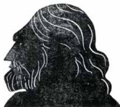
Njord: zeul marinarilor și al pescarilor.