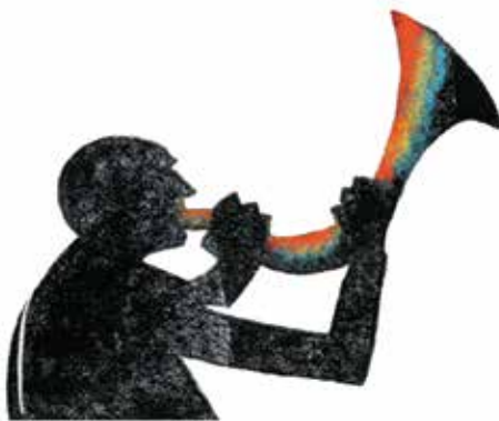
Heimdall: străjerul zeilor.